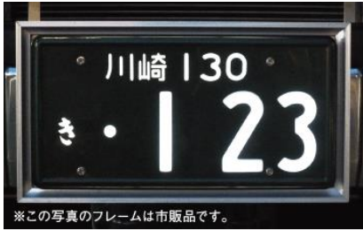
※この写真のフレームは市販品です。